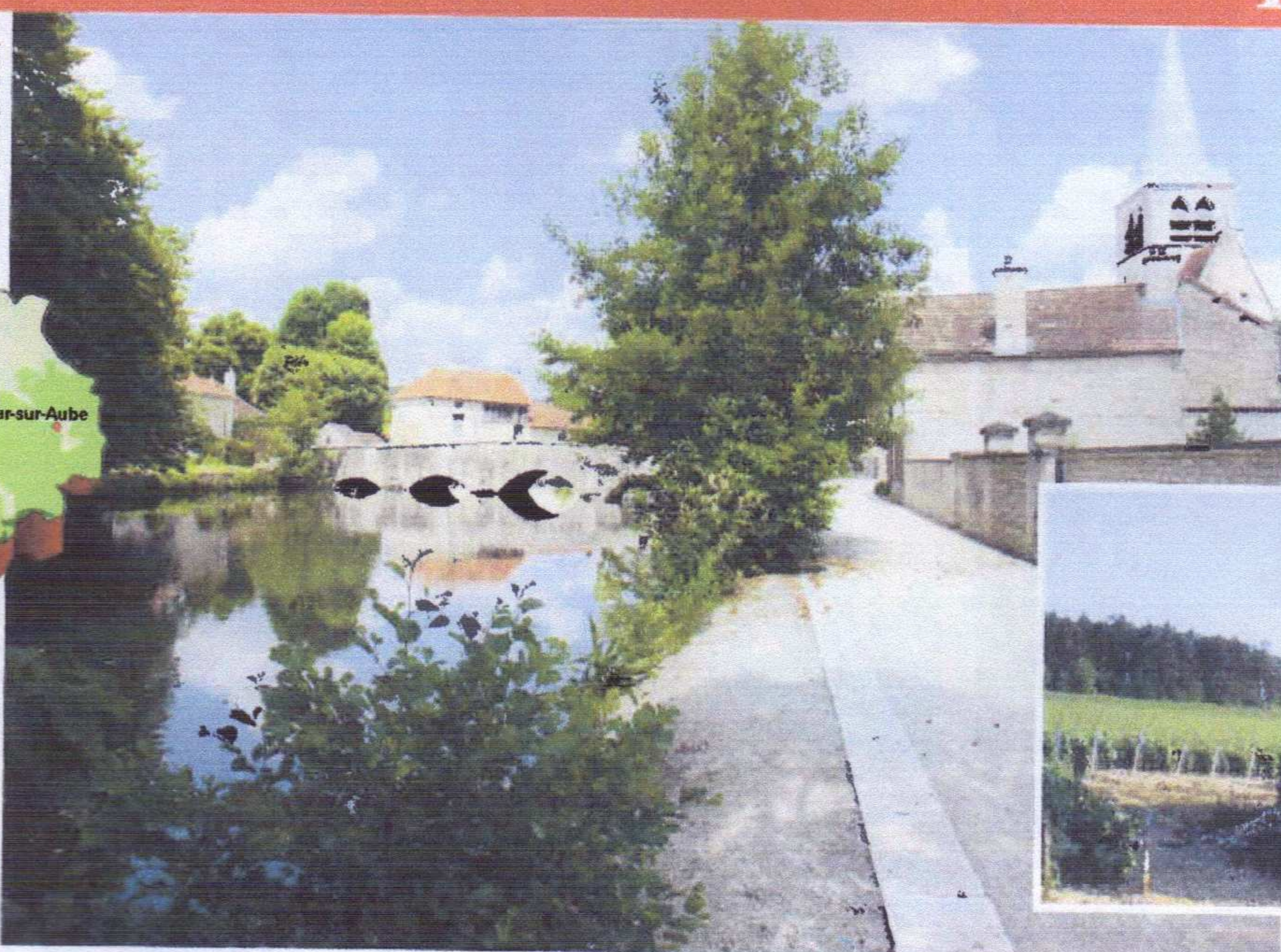
Le village des Riceys regroupe en fait, trois communes.